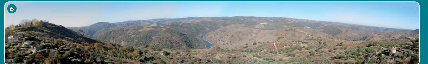
6 Mirador de la Faya