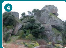
4 Teso de San Cristóbal