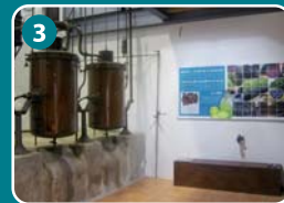
3 Museo del Vino