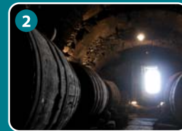
2 Bodega de Amable