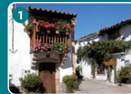
1 Arquitectura Popular